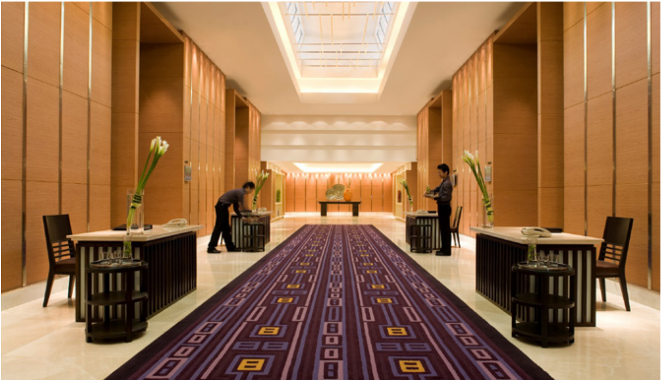
Courtyard by Marriott Bangkok

บริษัทฯ บริหารจัดการโดยยึดหลักการกำกับดูแลกิจการที่ดี (Good Corporate Governance) ดำเนินธุรกิจถูกต้องตามกฎหมาย ยึดหลักคุณธรรมและจริยธรรมธุรกิจ เปิดเผยข้อมูลด้วยความโปร่งใสตรงไปตรงมา พัฒนาระบบควบคุมภายใน และมีกลไกการตรวจสอบที่ดีและเหมาะสม การดำเนินงานคำนึงถึงความรับผิดชอบต่อผู้ถือหุ้นและผู้ที่มีส่วนได้เสียทุกฝ่าย โครงสร้างคณะกรรมการ กลไกการกำกับดูแล การบริหารงาน แสดงให้เห็นถึงศักยภาพและความรับผิดชอบต่อเรื่องต่างๆ ได้ดี ซึ่งนอกจากจะเป็นไปตามกรอบมาตรฐานที่ดีของ OECD (Organization for Economic Cooperating and Development) แล้ว บริษัทฯ ได้ศึกษาและนำแนวปฏิบัติที่ดีทั้งในประเทศ และต่างประเทศนำมาปฏิบัติ อาทิ การจัดตั้งคณะกรรมการชุดย่อย 4 ชุด เพื่อช่วยกำกับดูแลการบริหารจัดการในแต่ละเรื่องให้ละเอียดมากขึ้น ตลอดจนการ