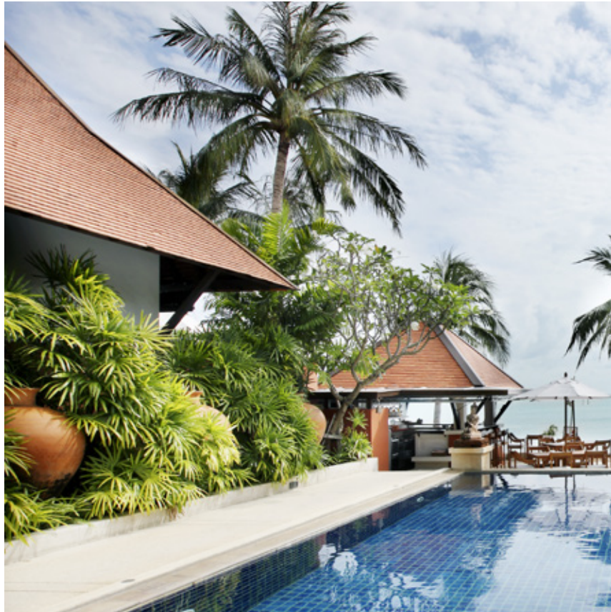
Renaissance Koh Samui Resort Report and Spa

ประกอบด้วยกรรมการ 4 คน ประธานกรรมการเป็นกรรมการอิสระ และสมาชิกอีก 3 คน ที่ไม่มีส่วนเกี่ยวข้องกับการบริหาร มีหน้าที่รับผิดชอบในการพิจารณาโครงสร้างคณะกรรมการ กำหนดคุณสมบัติเฉพาะตำแหน่ง พิจารณาและสรรหาบุคคลผู้ทรงคุณวุฒิเข้าดำรงตำแหน่งกรรมการ ตลอดจนประเมินผลงานของคณะกรรมการ และคณะกรรมการชุดย่อยที่คณะกรรมการ แต่งตั้งขึ้น และกำกับดูแลให้กรรมการ ผู้บริหารและพนักงานทุกระดับปฏิบัติตามแนวทางการกำกับดูแลกิจการที่ดี (Good Corporate Governance) และจรรยาบรรณธุรกิจ (Code of Conduct)