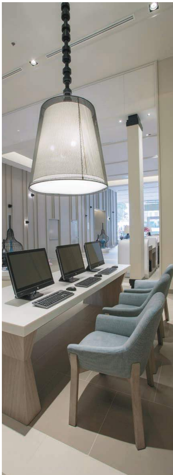
เมอร์เคียว พัทยา ไอเซ็น รีพอร์ต

ปี 2557 บริษัทฯ จัดให้มีการประชุมคณะกรรมการ 7 ครั้ง คณะกรรมการตรวจสอบ 4 ครั้ง คณะกรรมการยุทธศาสตร์และการลงทุน 4 ครั้ง คณะกรรมการสรรหาและบรรษัทภิบาล 3 ครั้ง และ คณะกรรมการพัฒนาผู้บริหารระดับสูงและกำหนดค่าตอบแทน 3 ครั้ง ทุกครั้งมีการจดบันทึกรายงานการประชุมไว้เป็นลายลักษณ์อักษร และเก็บไว้ ณ สำนักงานเลขานุการ และบน Data Server ซึ่งผู้มีส่วนเกี่ยวข้องภายในสามารถเข้าถึงได้โดยสะดวก ตามตารางการเข้าประชุมของกรรมการ ประจำปี 2557 ดังต่อไปนี้